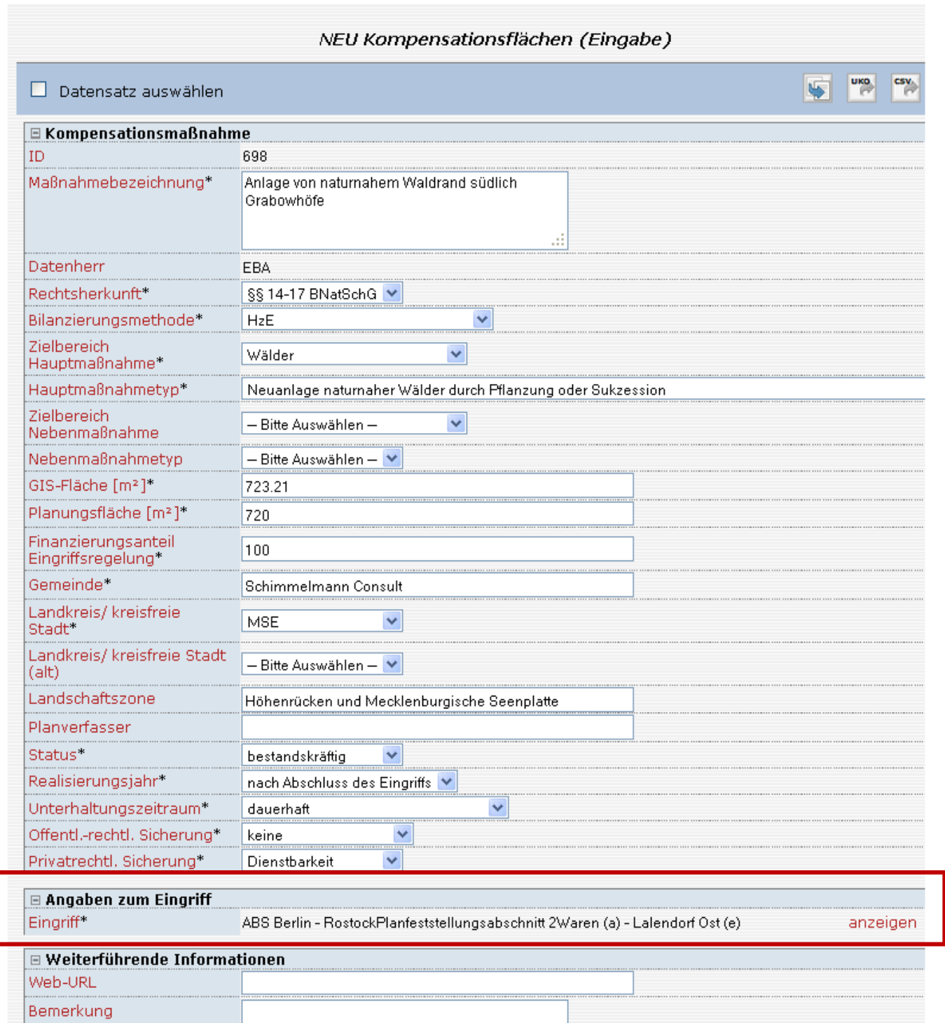
Abbildung 1: Thema „Kompensationsflächen (Eingabe)“ – Beispiel einer Kompensationsmaßnahme